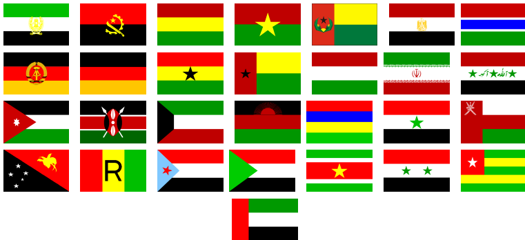
Slika 1: Zastave 1. skupine