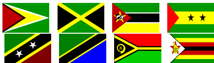
Slika 8: Zastave 8. skupine