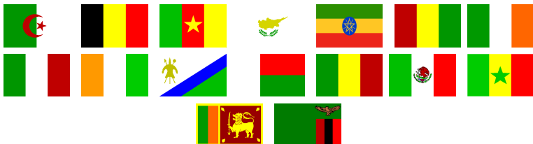
Slika 7: Zastave 7. skupine