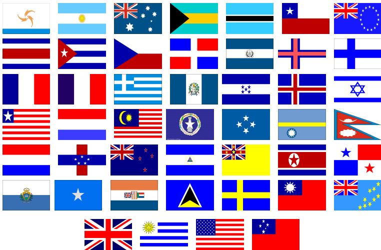
Slika 3: Zastave 3. skupine