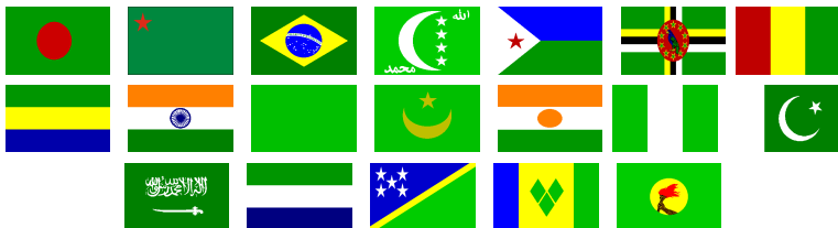
Slika 5: Zastave 5. skupine