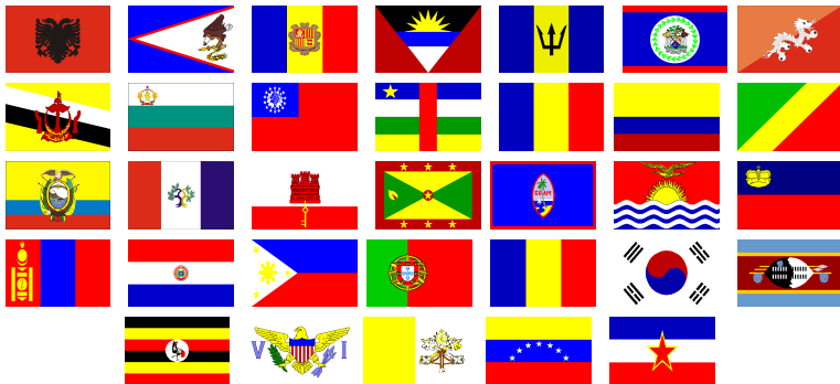
Slika 2: Zastave 2. skupine